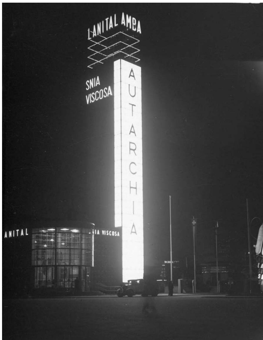
Padiglione della SNIA Viscosa alla Fiera di Milano del 1937, arch. Eugenio Faludi