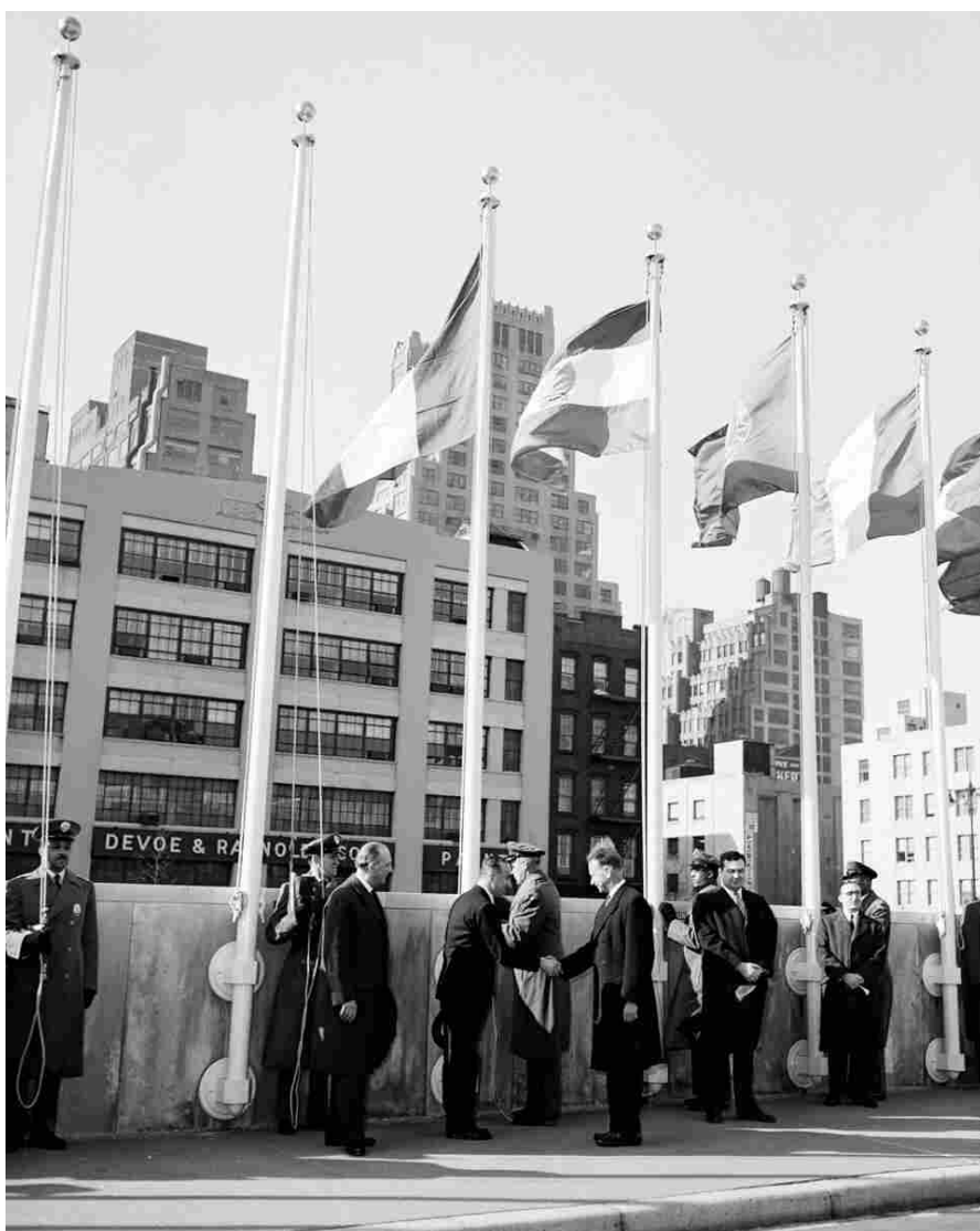
Secretary-General Dag Hammarskjöld (right) shakes hands with Representative Casardi

A tal fine vengono analizzati dagli autori alcuni aspetti rilevanti di tipo storico, mentre altri che sono correlati all'attuale agenda internazionale e al sistema di informazione e comunicazione. Con respiro interdisciplinare, i contributi adottano metodologie di studio diverse e approcci innovativi e sono raccolti in tre sezioni: UN System, comunicazione e information environment, Sfide e istituzioni di un sistema globale. Sono analizzate tematiche che le Nazioni Unite qualificano Global Issues (dalla sicurezza dell'Outer Space alla questione nucleare), insieme ad alcuni significativi casi di studio relativi all'attività dell'ONU e dello UN System. Vengono inoltre individuate nuove piste di ricerca, e segnalate fonti per la storia internazionale sinora poco utilizzate, a partire dalla importante documentazione del MAECI sull'ONU anche alla luce di un altro anniversario: i 70 anni dall'ingresso dell'Italia al Palazzo di Vetro.