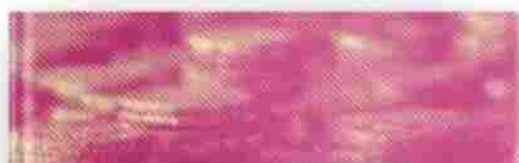
Immagine prelevata da internet. Problemi o domande? Contattaci .

Storie di donne al vertice della finanza: un viaggio tra stereotipi, conquiste e nuove visioni