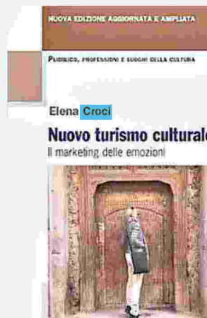
Nuovo turismo culturale Elena Croci Franco Angeli, pp. 169, 24 euro

I conflitti globali e la vita post-pandemica ci impongono di ripensare al concetto di fare turismo e cultura ed è su questi elementi che va plasmata l'offerta. Come? Lo suggerisce la nuova edizione di un manuale per addetti ai lavori e non, per futuri manager del turismo e per coloro che vedono nel settore una concreta piattaforma di rilancio del Paese. Si deve passare dal solo vedere e fotografare a un turismo che elabora contenuti di conoscenza culturale, sociale ed emozionale.