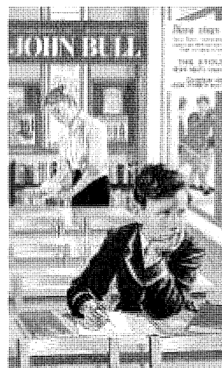
RIVISTA Copertina del settimanale inglese "John Bull" del febbraio 1957

I nostri nonni conoscevano a memoria la Divina Commedia e sapevano tradurre all'impronta versioni "impossibili"