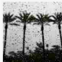
10:39 Maltempo California: danni a Los Angeles, 1.100 senza elettricità