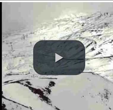
L'Etna con la neve nel giorno del Solstizio d'Inverno 2014