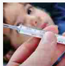
11:17 Salute: disturbi inventati nei bimbi, spesso è mamma a crearli