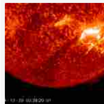
10:57 Sole: potente brillamento classe X1.8, blackout radio