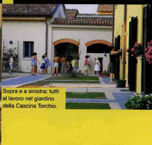
Sopra e a sinistra: tutti al lavoro nel giardino della Cascina Torchio.