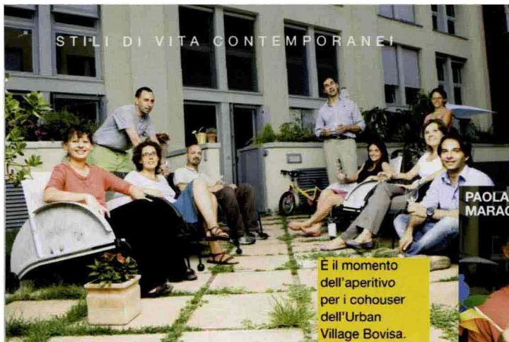
È il momento dell'aperitivo per i cohouser dell'Urban Village Bovisa.