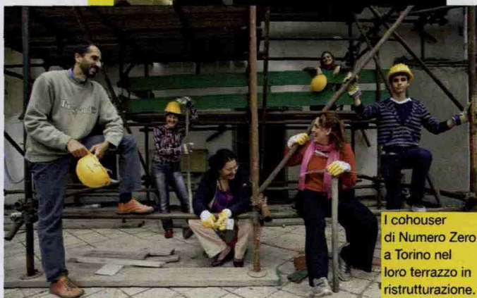
I cohouser di Numero Zero a Torino nel loro terrazzo in ristrutturazione.