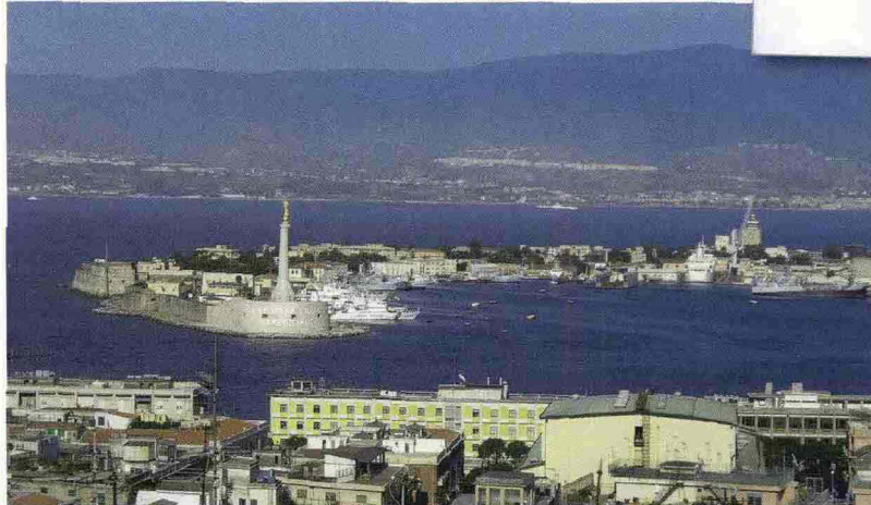
Il porto di Messina

è a rischio per fenomeni geotettonici e sismici. Le Valutazioni Ambientali Strategiche che sono state fatte sono superficiali e lacunose. Il ponte modificherebbe la percezione del luogo – nodo di culture mitologiche – che storicamente ha una grande forza evocativa. L'impatto ambientale, poi, sarebbe notevole: metterebbe a rischio la conservazione di ambienti umidi, marini e costieri eccezionali, essendo baricentro di un importante sistema di aree protette: Nebrodi, Aspromonte, Etna, Alcantara, Eolie, Isola Bella e RNO Laguna di Capo Peloro e punto di transito fondamentale per le migrazioni di numerose specie.