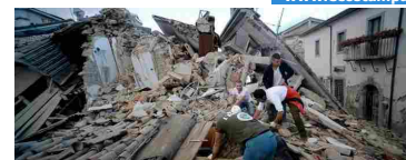
Terremoto magnitudo 6 nel centro Italia disastro, vittime

Via Pietro del Tocco 74/N Martina Franca (TA)