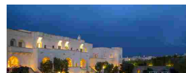
Fasano: Borgo Egnazia, miglior hotel del