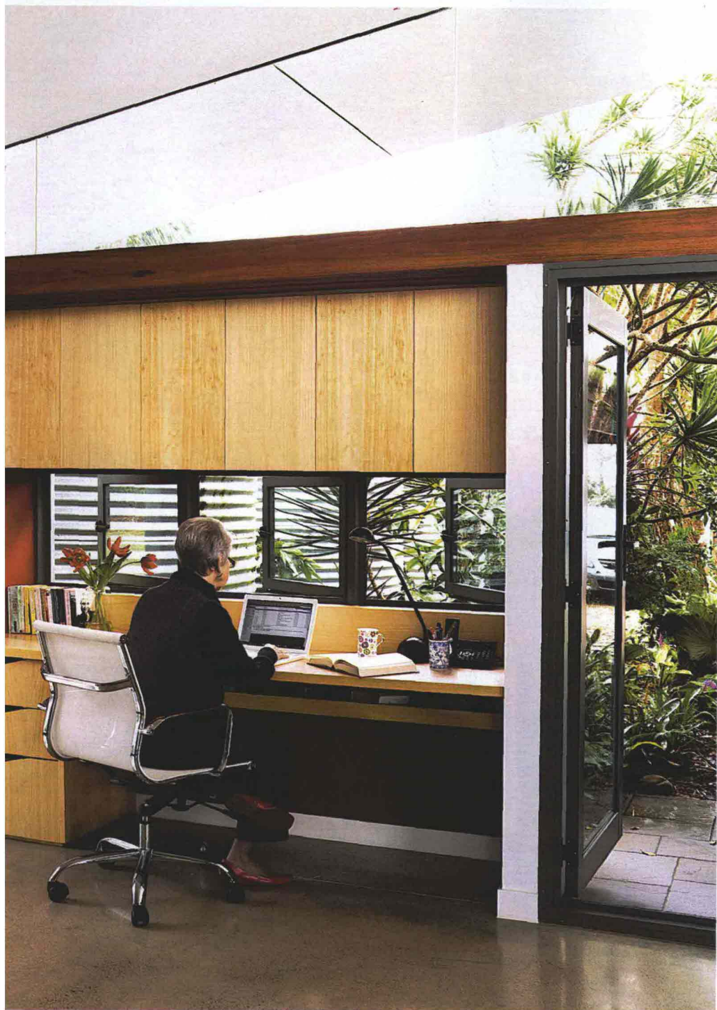
UNA ANZIANA SIGNORA USA INTERNET SUL SUO COMPUTER