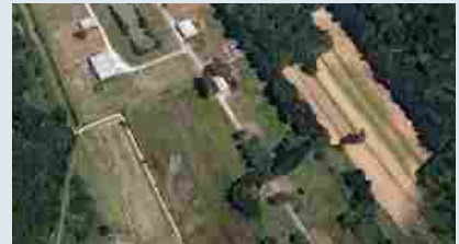
Terreni Capannori LU