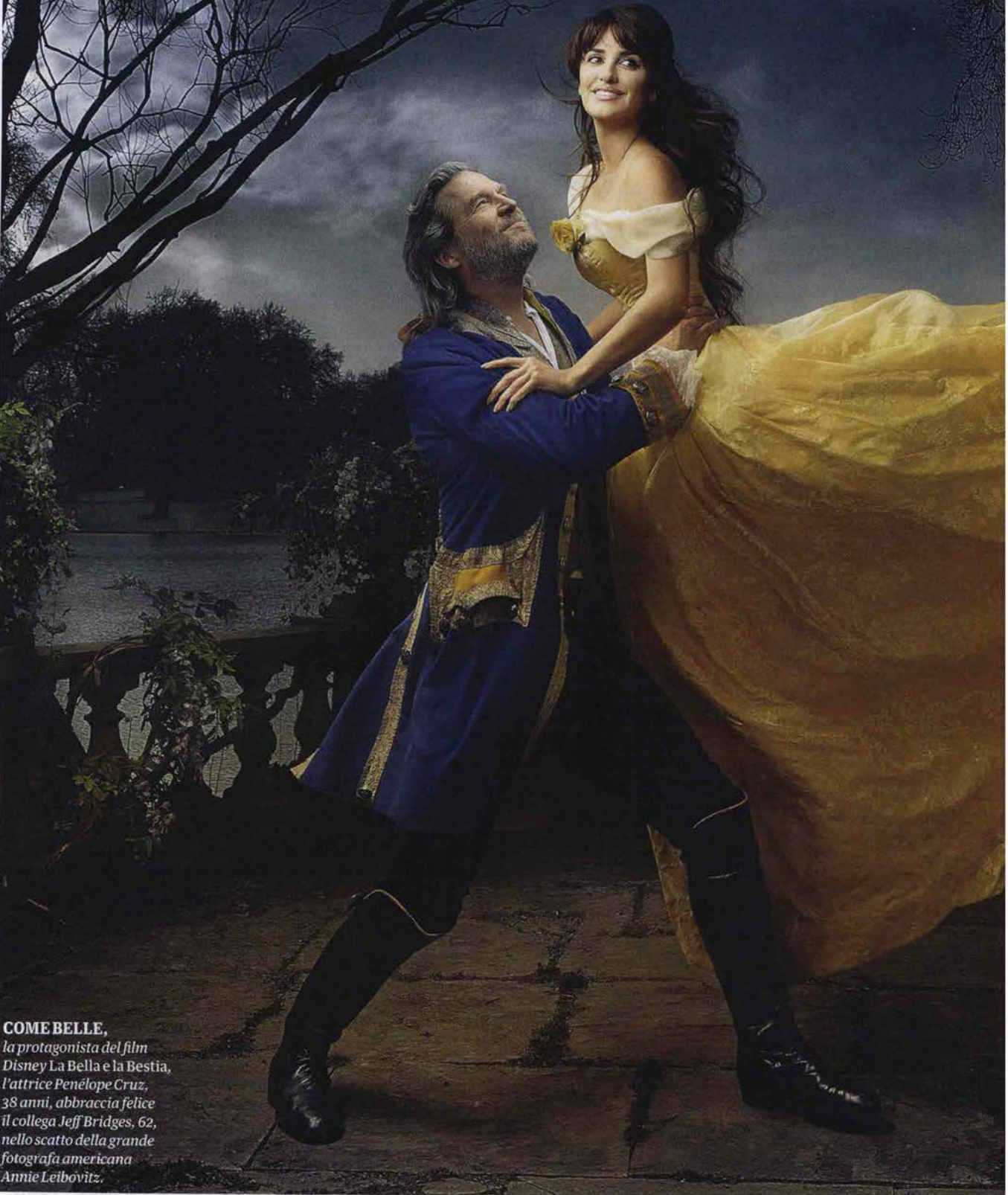
COME BELLE, la protagonista del film Disney La Bella e la Bestia , l'attrice Penélope Cruz, 38 anni, abbraccia felice il collega Jeff Bridges, 62, nello scatto della grande fotografia americana Annie Leibovitz.

Ritaglio stampa ad uso esclusivo del destinatario, non riproducibile.