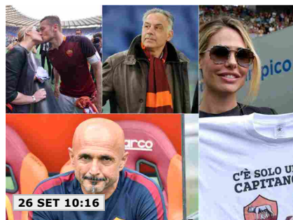
26 SET 10:16