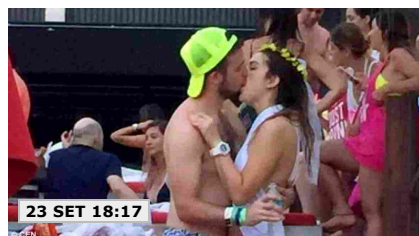
23 SET 18:17