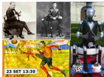
23 SET 13:30