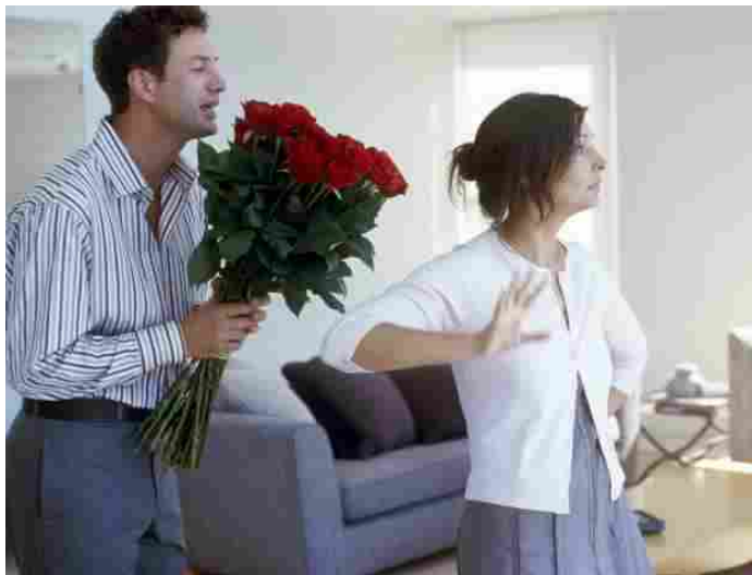
Secondo una psicoterapeuta di coppia conviene confessare al partner un tradimento. Per 10 buoni motivi

La confessione dell'infedeltà, dunque, offre a chi è stato tradito l' opportunità preziosa di capire quanto sia assurdo pensare di possedere chi amiamo ed essere convinti che il suo amore sia dato per scontato e per sempre . Per far questo però chi ha subito l'infedeltà non deve commettere errori spesso comuni: negare al partner la possibilità di chiarire e riparare; enfatizzare le conseguenze spiacevoli del tradimento; mostrare rancore; essere incapace di comprendere empaticamente quello che può provare il partner che ha tradito, soprattutto se chiede scusa".