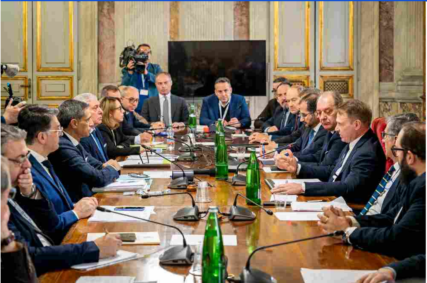
Xylella, svolta al Masaf: per la prima volta Governo, Regioni e associazioni