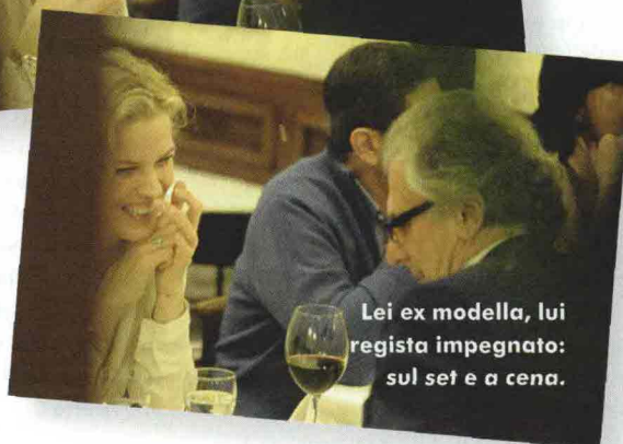
Lei ex modella, lui regista impegnato: sul set e a cena.