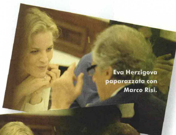
Eva Herzigova paparazzata con Marco Risi.