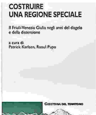
La copertina del libro