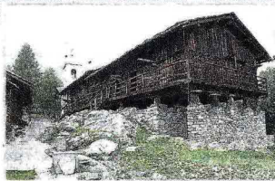
Sopra un «rascard», a destra la Stazione al Lago Nero di Sauze d'Oulx, di Carlo Mollino

La «Superleggera» del designer Gio Ponti rilegge l'antica sedia impagliata chiavarese